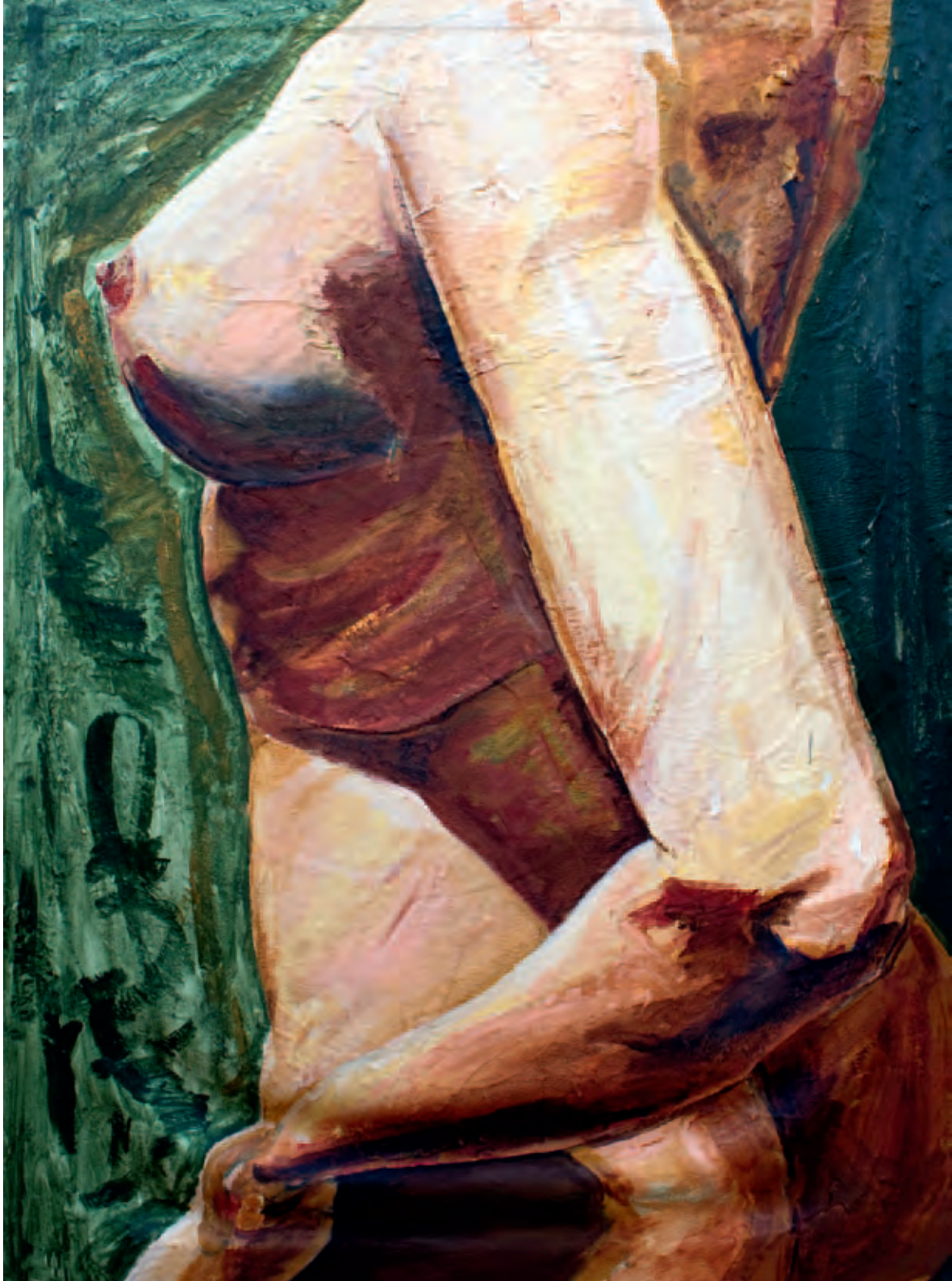
Piel de mujer Serie La piel de mis sentimientos Óleo s/soporte de pintura en bastidor 90 x 125 cm 2012