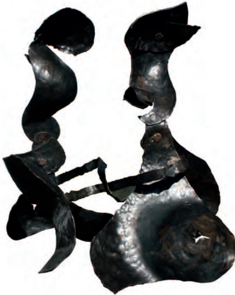
Ying Yang Serie Estudio formal