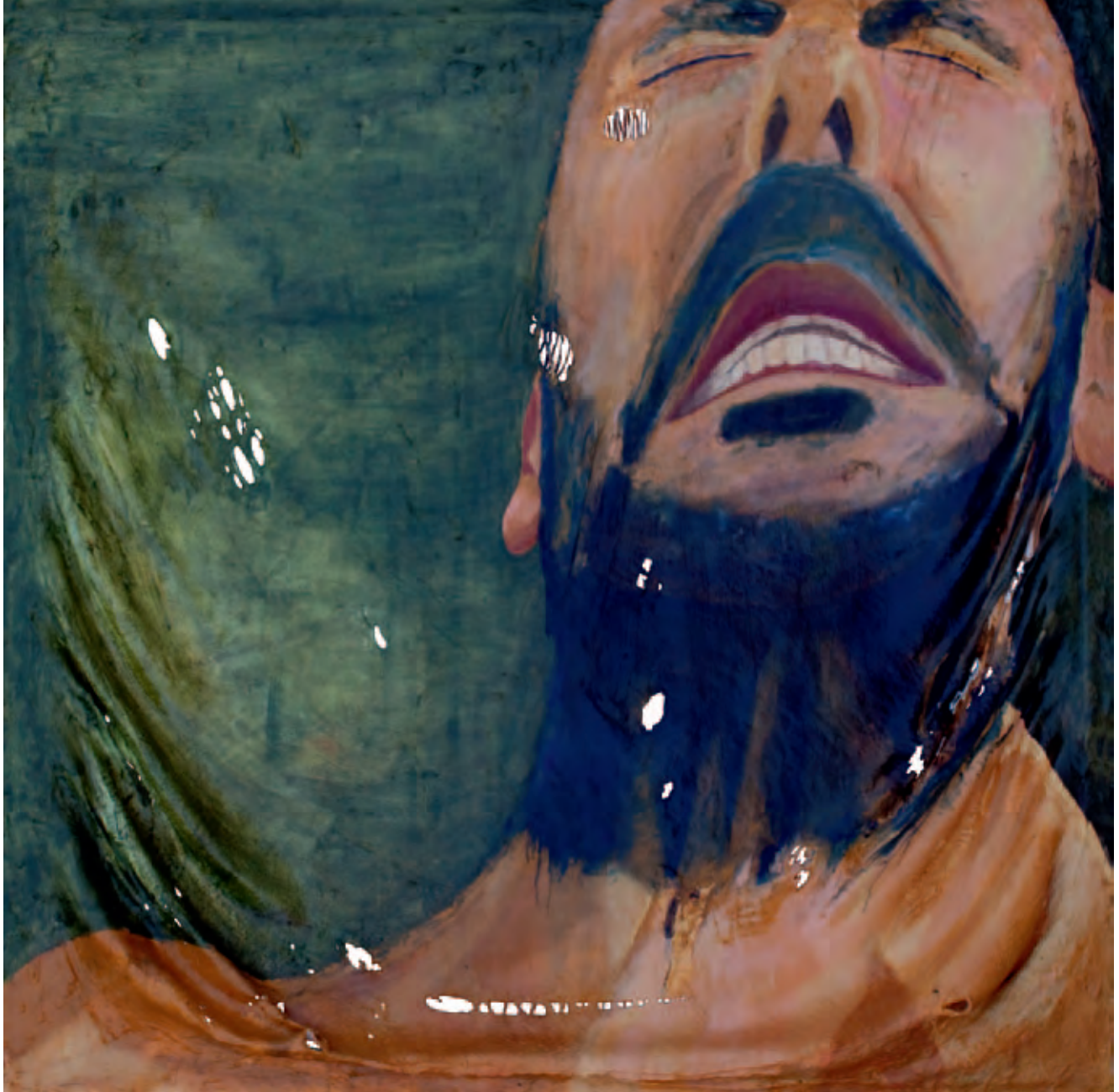
Tensión Serie La piel de mis sentimientos Óleo s/soporte de pintura en bastidor 189 x 189 cm 2011