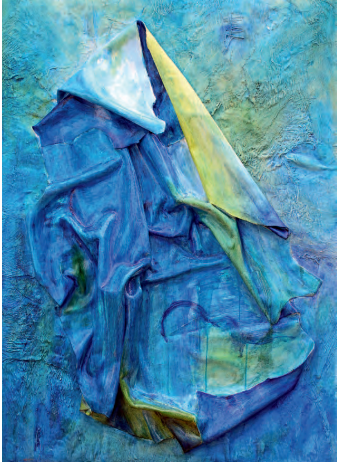
Piel de mar Serie Raíces Mixta s/fibra de palmera en bastidor 90 x 125 cm 2013