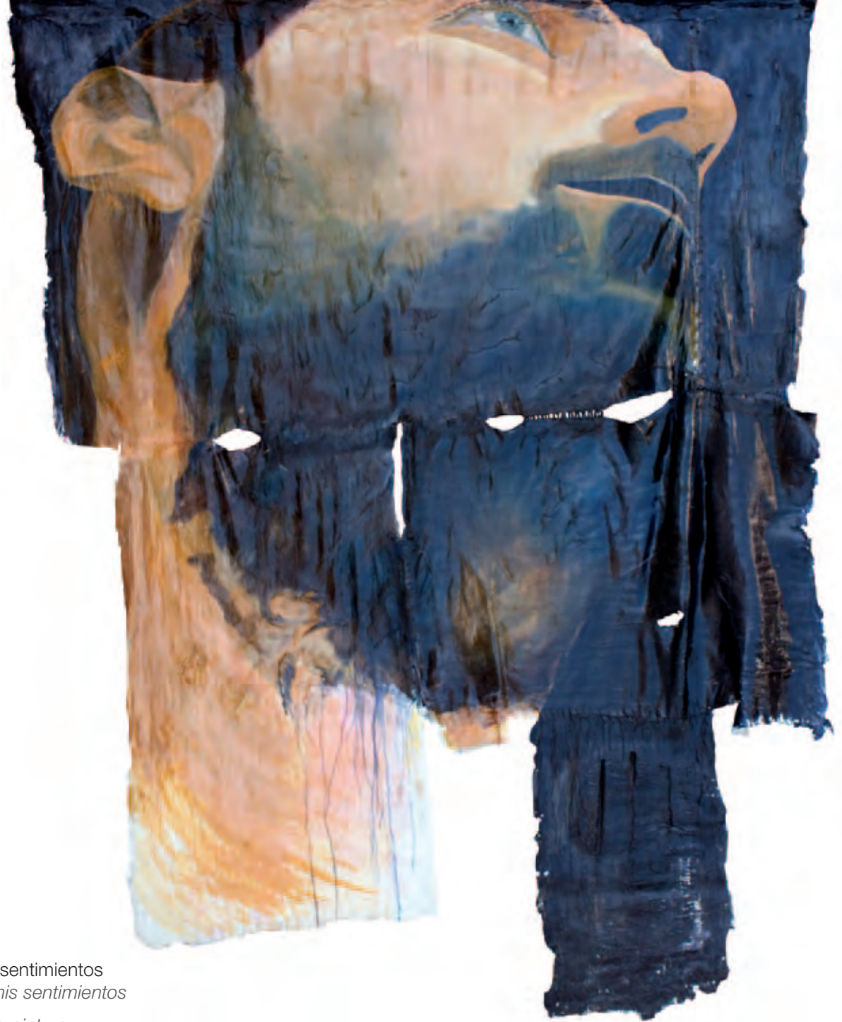
En busca de mis sentimientos Serie La piel de mis sentimientos

Óleo s/soporte de pintura 176 x 235 cm 2010