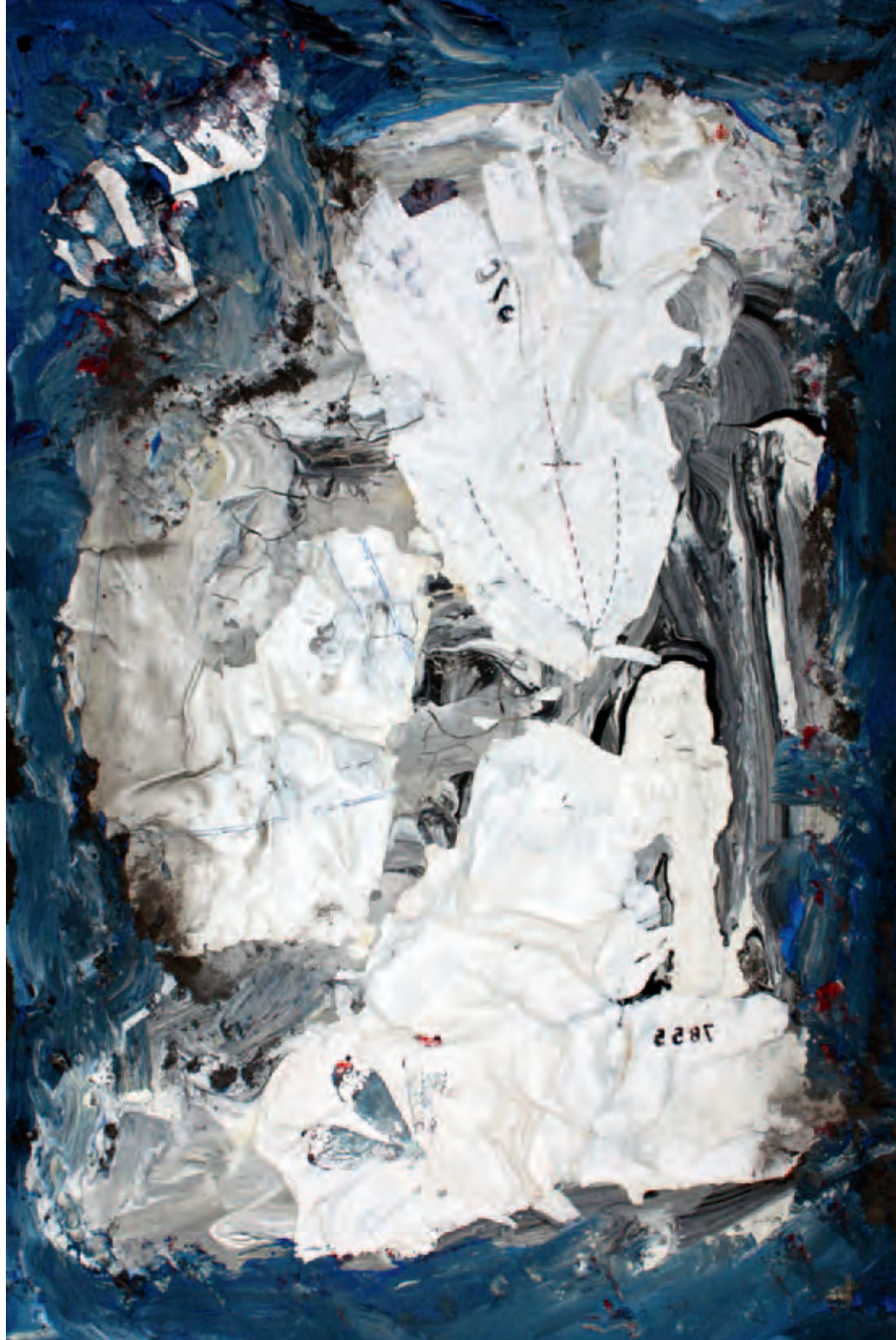
Patrones pintados Serie Raíces Mixta s/tabla 40 x 60 cm 2009