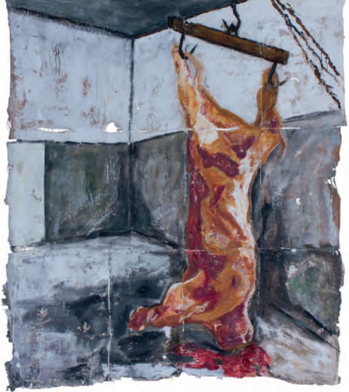
Arrancándome la piel Serie La piel de mis sentimientos

Mixta s/soporte de pintura 171 x 197 cm 2009