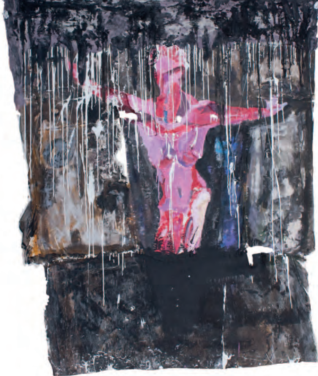
En carne viva Serie La piel de mis sentimientos Óleo s/soporte de pintura 182 x 213 cm 2009