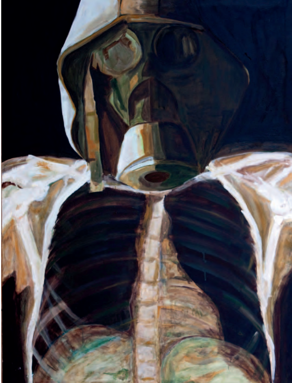
Asfixia Serie Estudio formal Óleo s/tela 120 x 160 cm 2011