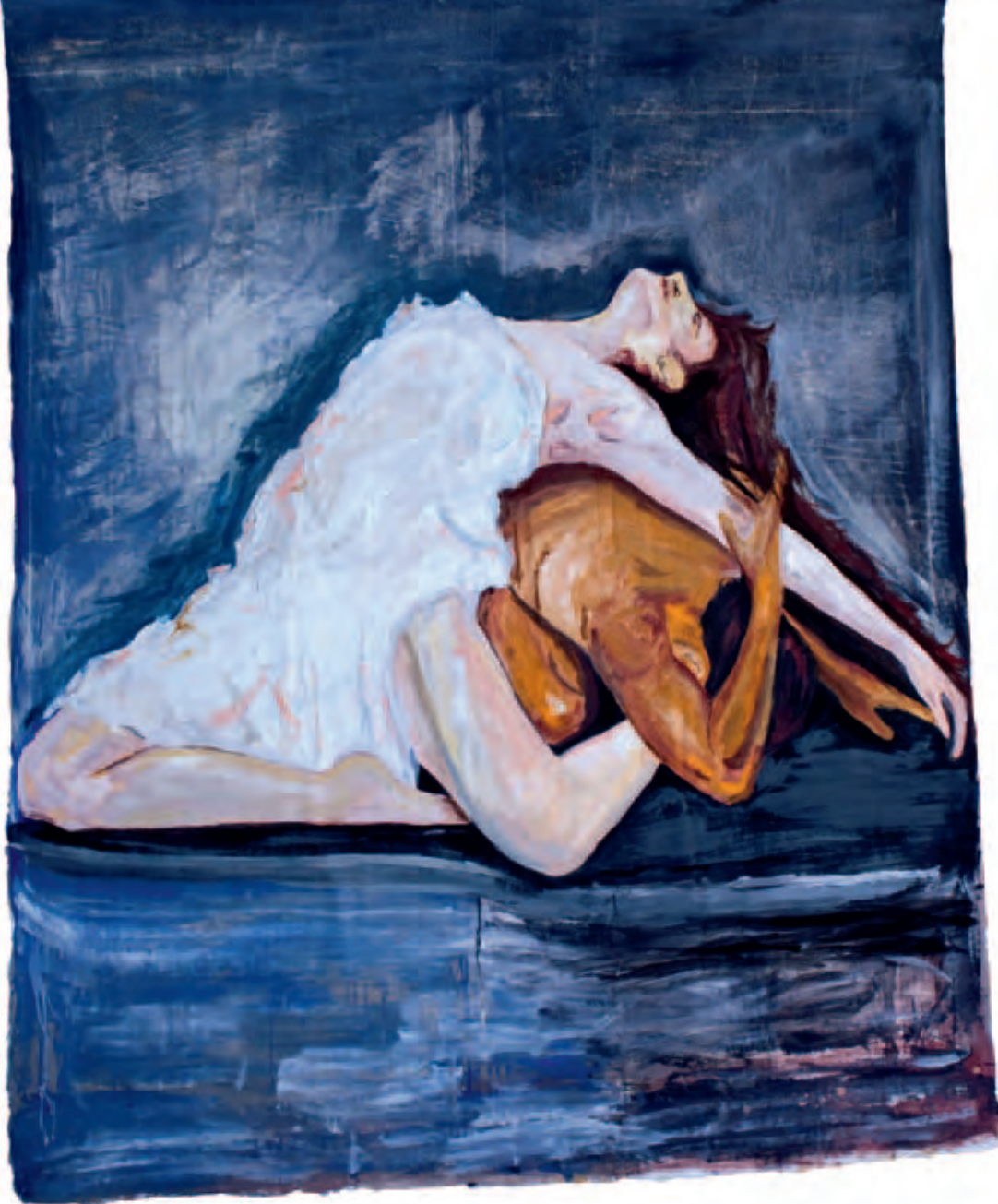
El descanso de tu alma Serie La piel de mis sentimientos

Óleo s/soporte de pintura 192 x 132 cm 2011