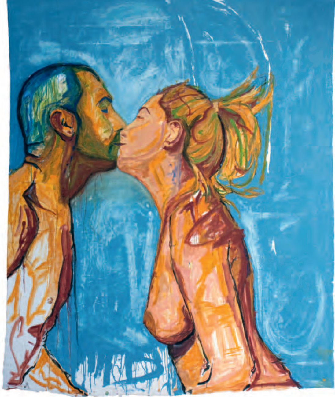
El beso Serie La piel de mis sentimientos Óleo s/soporte de pintura 191 x 230 cm 2011