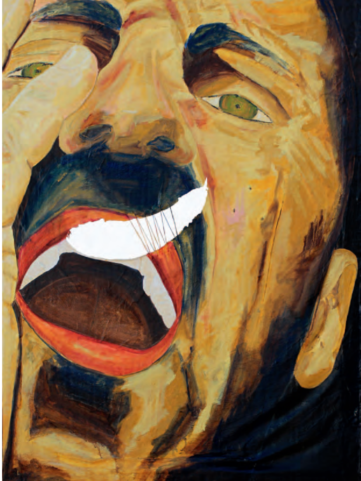
Mi grito Serie La piel de mis sentimientos Óleo s/soporte de pintura en bastidor 90 x 125 cm 2013